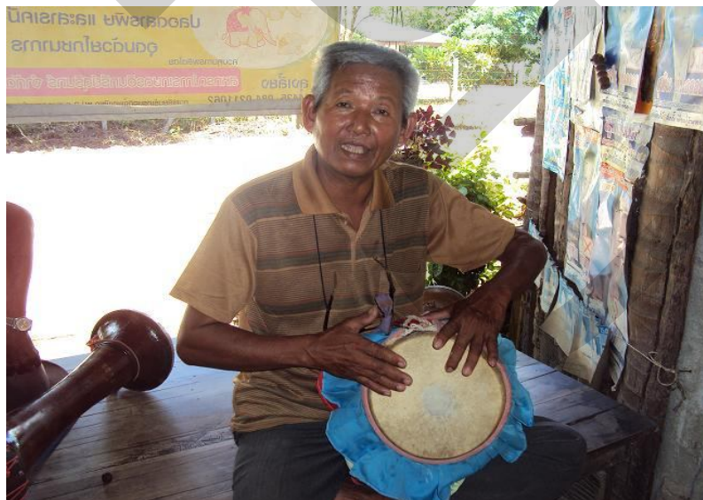
การตีบริเวณริมขอบของกลองยาวคล้ายกับการตีของเสียงเป้ง แต่จะต้องใช้นิ้วของอีกมือหนึ่งแตะบริเวณขอบของกลองยาวตามทันที