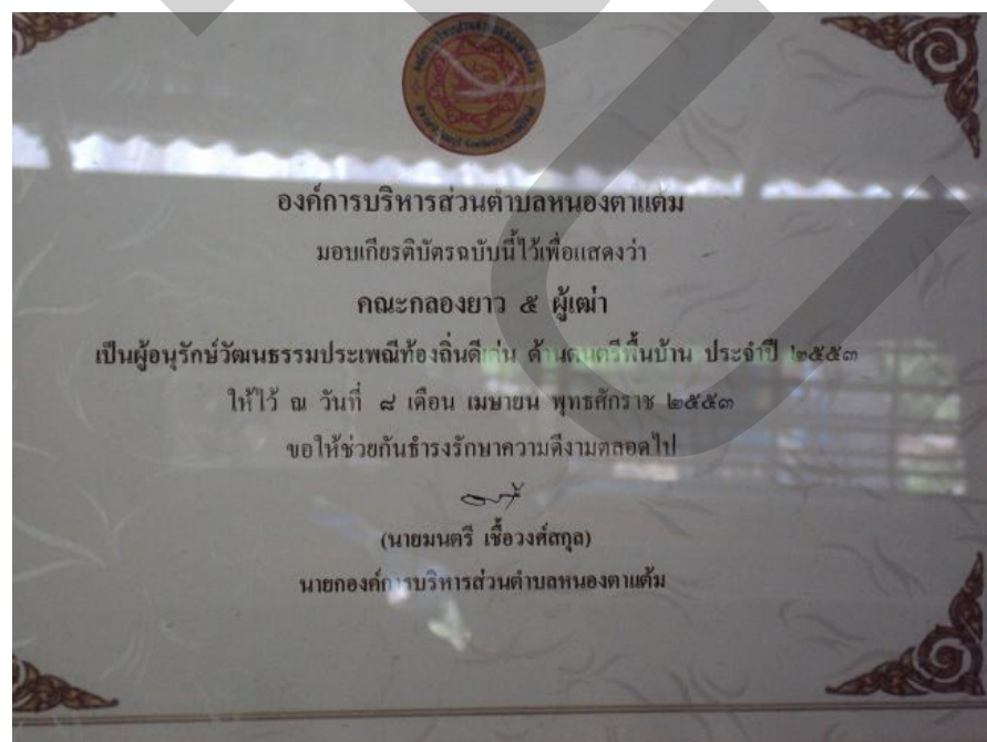
เกียรติบัตร "ผู้อนุรักษ์วัฒนธรรมประเพณีท้องถิ่นดีเด่น ด้านดนตรีพื้นบ้าน" จากองค์การบริหารส่วนตำบลหนองตาแต้ม พ.ศ.2553