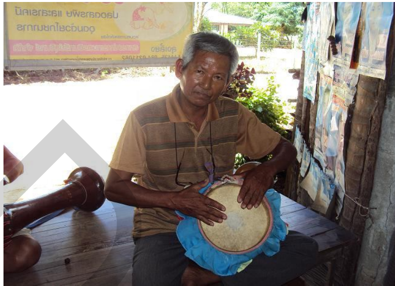
การตีบริเวณริมขอบของกลองยาว