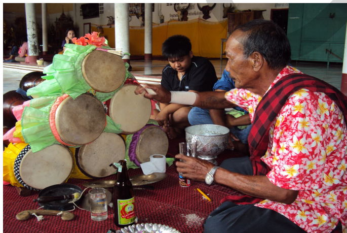
การปลุกเสกกลองยาว