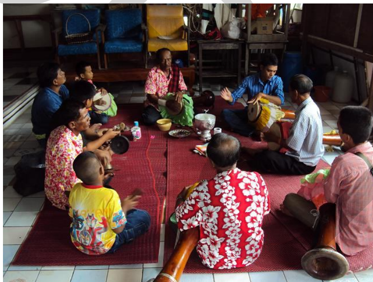
ภายหลังจากการปลุกเสกกลองยาวแล้ว สมาชิกในวงจึงทำการจ่าหน้ากลองเพื่อปรับแต่งเสียงกลองยาวร่วมกัน ก่อนที่จะนำไปเล่นจริง