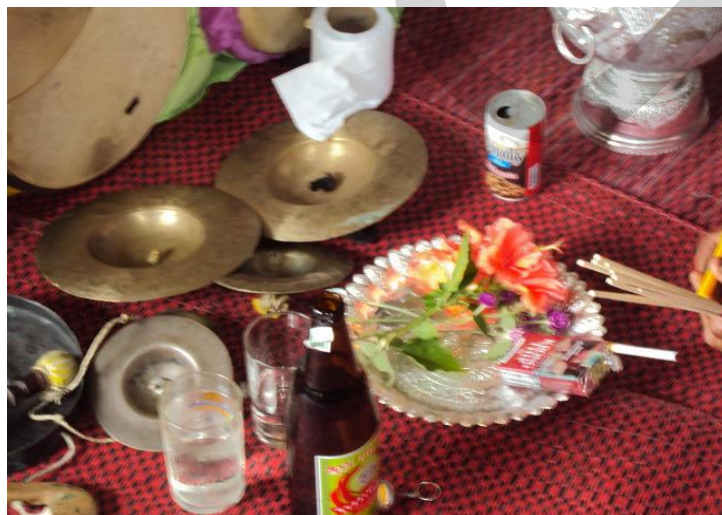
เครื่องเช่นไห้ว