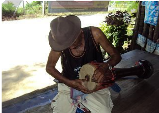
การจำหน้ากลองโดยการผสมขี้เถ้า