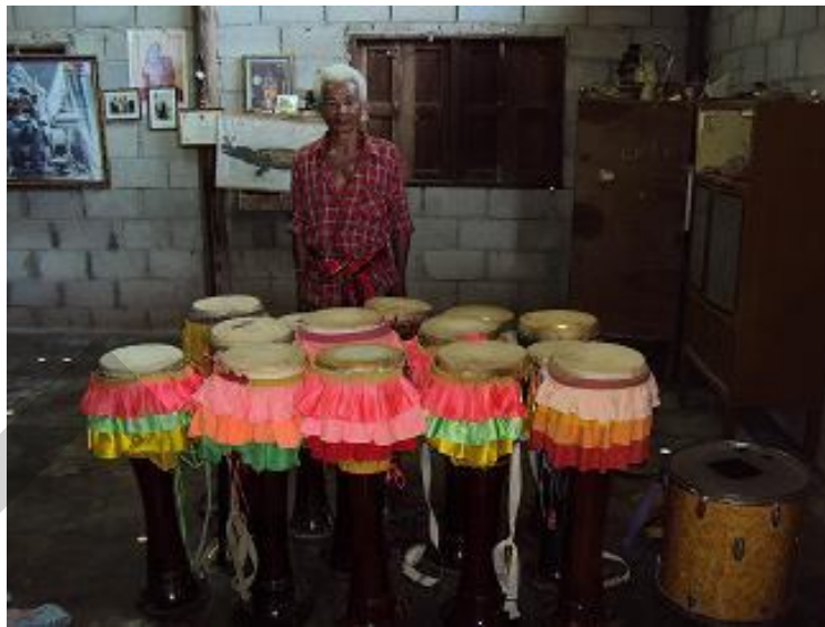
กลองยาวสำหรับการแสดงของวง 5 ผู้เฒ่าและวงศิษย์หลวงพ่อบาว ของนายเชี่ยม บุตรทองคำ