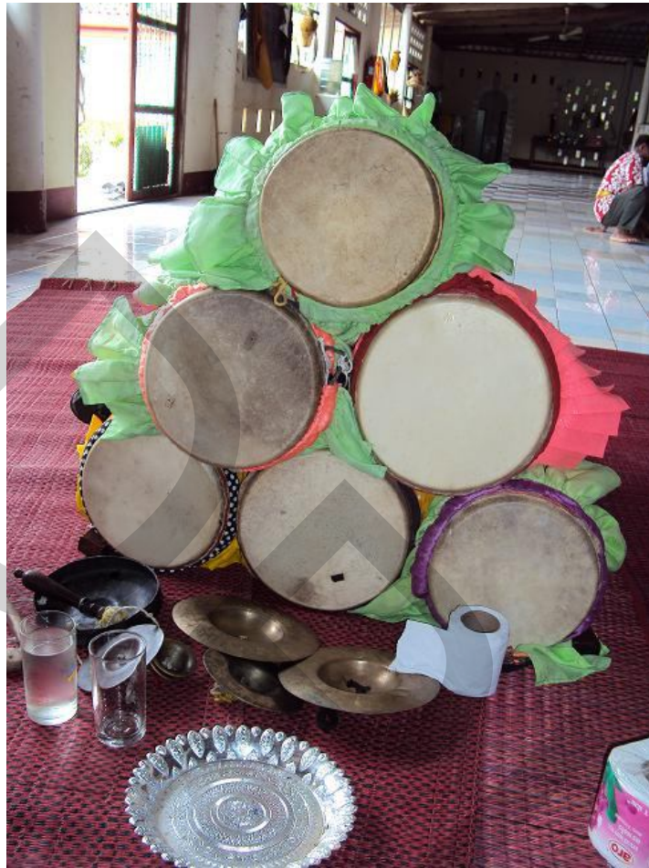
การนำกลองยาวที่จะใช้ในการแสดงมาจัดเรียงเป็นรูปสามเหลี่ยมหน้าจั่ว