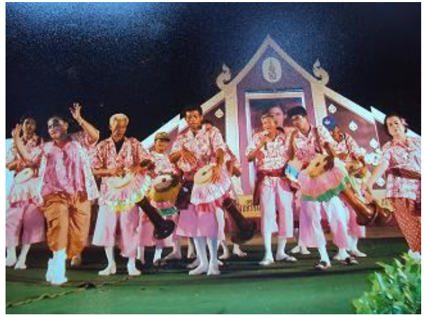
ภาพวง 5 ผู้เต่า ในขณะประกวดกลองยาว เนื่องในงานวันอนุรักษ์มรดกไทย จังหวัดประจวบคีรีขันธ์ พ.ศ.2553