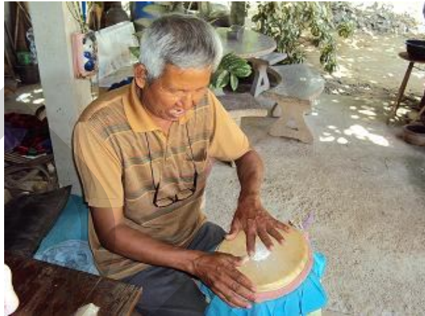
การโรยแป้งทับบริเวณขนมโก๋

2) การนำแป้งโรยทับบริเวณที่ติดขนมโก๋ หรือการผสมขี้เถ้าในขนมโก๋ เพื่อป้องกันไม่ให้ขนมโก๋ติดมือในขณะที่ตักลงยาว นอกจากนี้ การผสมขี้เถ้ายังทำให้มองเห็นการจำหน้ากลองได้อย่างชัดเจน