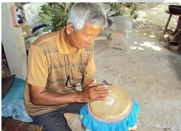
การติดขนมโก๋ลงบนหนังกลองยาว