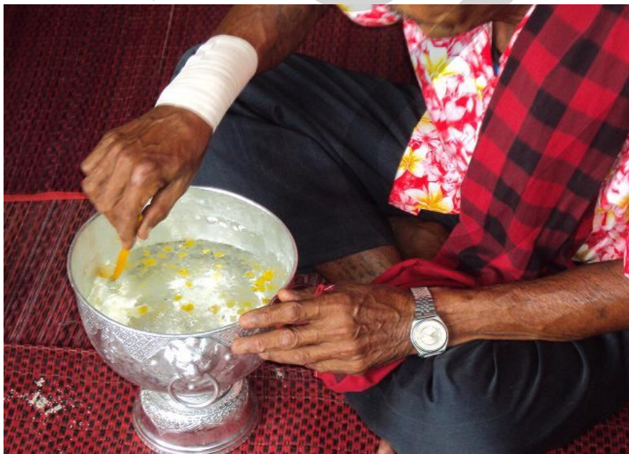
การทำน้ำมันต์เพื่อใช้ในพิธีกรรม