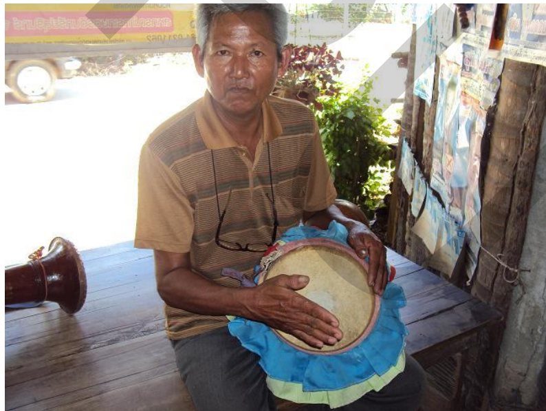
การตีบริเวณตรงกลางของกลองยาวโดยนิ้วมือชิดกัน