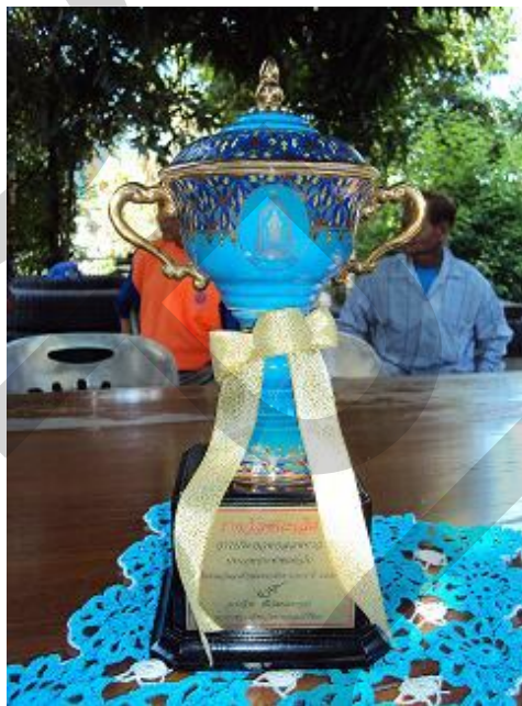
ถ้วยรางวัลชนะเลิศจากการประกวดกลองยาว เนื่องในงานวันอนุรักษ์มรดกไทย จังหวัดประจวบคีรีขันธ์ พ.ศ.2553

สำหรับรางวัลที่วิ่ง 5 ผู้เฒ่าได้รับจากการประกวด คือ รางวัลชนะเลิศ การประกวดกลองยาว ประเภทประชาชนทั่วไป เนื่องในงานวันอนุรักษ์มรดกไทย จังหวัดประจวบคีรีขันธ์ ประจำปี พ.ศ.2553 โดยได้รับรางวัลเป็นถ้วยและเงิน 3,000 บาท ในการประกวดครั้งนี้มีผู้เข้าร่วมแข่งขันในประเภทเดียวกันจำนวน 3 วง และทางองค์การบริหารส่วนตำบลหนองตาเต๋มได้สนับสนุนในการประกวดโดยการให้ทุนอุดหนุนแกว่ง 5 ผู้เฒ่า 7,000 บาท และได้ให้เสื้อผ้าสำหรับใส่ในการแสดง นอกจากนี้ ทางองค์การบริหารส่วนตำบลหนองตาเต๋มยังได้มอบเกียรติบัตรแกว่งในฐานะที่เป็นผู้อนุรักษ์วัฒนธรรมประเพณีท้องถิ่นดีเด่น ด้านดนตรีพื้นบ้านอีกด้วย