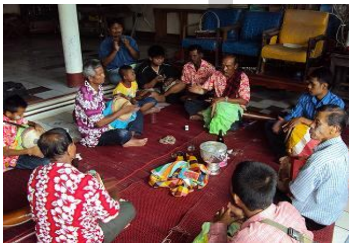
วง 5 ผู้เฒ่า: การประโคมกลองยาวในขณะบวชนาค ที่วัดหนองตาแต้ม