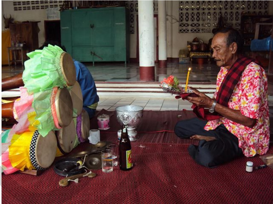
การเริ่มต้นประกอบพิธีกรรมการปลุกเสกกลองยาว