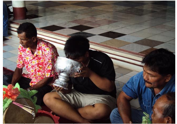
สมาชิกในวงรับการพรมน้ำมนต์และดื่มน้ำมนต์