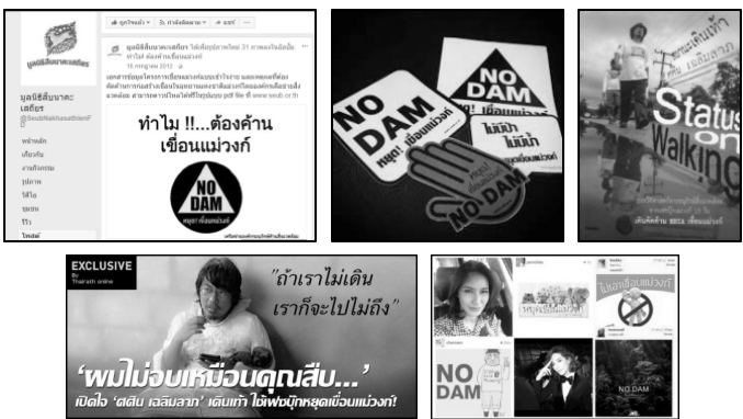
ภาพที่ 1 ตัวอย่างสื่อในการคัดค้านโครงการก่อสร้างเขื่อนแม่วงก์

1.4 สื่อในนามกลุ่มอาสาสมัครและบุคคลทั่วไป เช่น เฟสบุ๊กแฟนเพจ “กลุ่มคนสนับสนุนอ.ศศิณ” เฟสบุ๊กแฟนเพจ “นิสิตจุฬาฯคัดค้านเขื่อนแม่วงก์” อินโฟกราฟิกเรื่อง “รู้แน่ แม่วงก์” โดยกลุ่มรู้สู้ Flood วิดีโออินโฟกราฟิก “ความจริงของการสร้างเขื่อนแม่วงก์” โดยชมรมอนุรักษัธรรมชาติ และสิ่งแวดล้อม มศว กิจกรรมหน้ากากเสื้อโคร่งโดยกลุ่มเครือข่ายเยาวชนตลอดจนสื่อโซเชียลมีเดียของบุคคลผู้มีชื่อเสียง และบุคคลทั่วไปที่มาร่วมเล่าเรื่องผ่านรูปแบบต่าง ๆ เช่น บทเพลง บทกวี เล่าเรื่องในเว็บบล็อก ตั้งกระทู้พันทิป ฯลฯ และที่สำคัญ คือ กลุ่ม Green Move Thailand ซึ่งรวมกลุ่มอาสาสมัครกันเอง ตั้งหัวข้อใน change.org และจัดกิจกรรมต่อเนื่อง คือ เดิน-ยื่น-หยุด เขื่อนแม่วงก์ เป็นต้น ซึ่งสื่อจากกลุ่มอาสาสมัครและบุคคลทั่วไปเหล่านี้ช่วยให้เกิดการกระจายของเรื่องเล่า และเชิญชวนผู้คนให้เข้ามาร่วมคัดค้านโครงการก่อสร้างเขื่อนแม่วงก์มากขึ้น